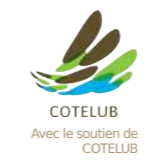
COTELUB Avec le soutien de COTELUB

Office de Tourisme Luberon Côté Sud Point informations de Cucuron 11, cours de Pourrières - 84160 Du mardi au samedi +33 (0)4 90 77 28 37 contact@luberoncotesud.com www.luberoncotesud.com