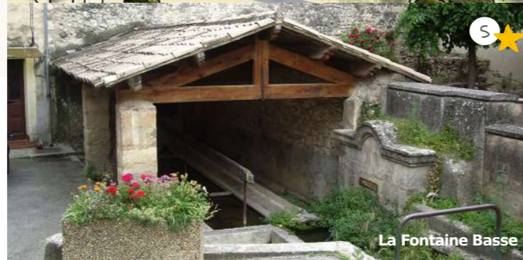
La Fontaine Basse