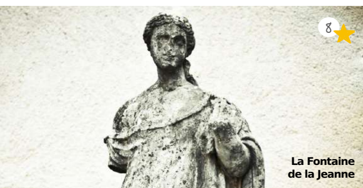
La Fontaine de la Jeanne

Datant du XVIème siècle, elle est édifée lors de la construction de la seconde enceinte. Elle ferme la Rue du Cléda, qui était bordée de moulins à eau à cette époque. Pas de vestiges ici.