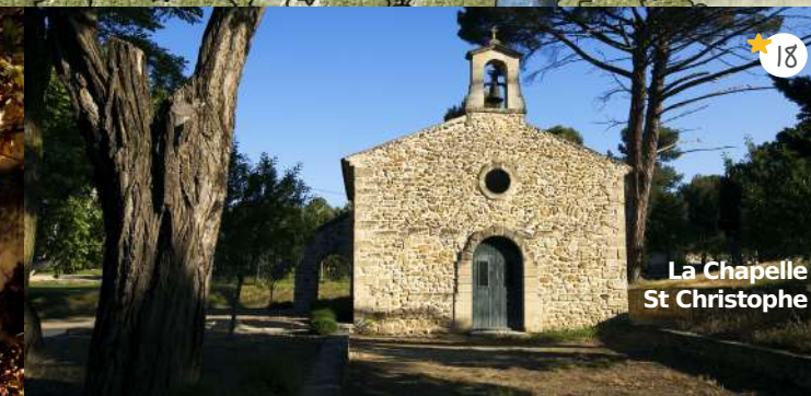
La Chapelle St Christophe