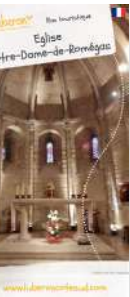
Pour en savoir plus, demandez la brochure.

Dans la 1ère chapelle sud datant du XIIIème siècle, il est réalisé au début du XVIème siècle un groupe en pierre sculptées : « la mise au tombeau ». L'essentiel du mobilier (statues en bois, tableaux, chaire...) date du XVIIème siècle, tout comme la sacristie. Le pyramidion a été restauré en 2014 sur les plans et méthodes de constructions originelles par les compagnons charpentiers installés au village.