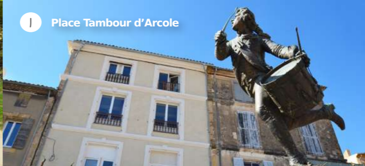
1 Place du Tambour d'Arcole