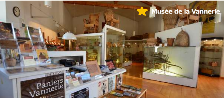
★ Musée de la Vannerie