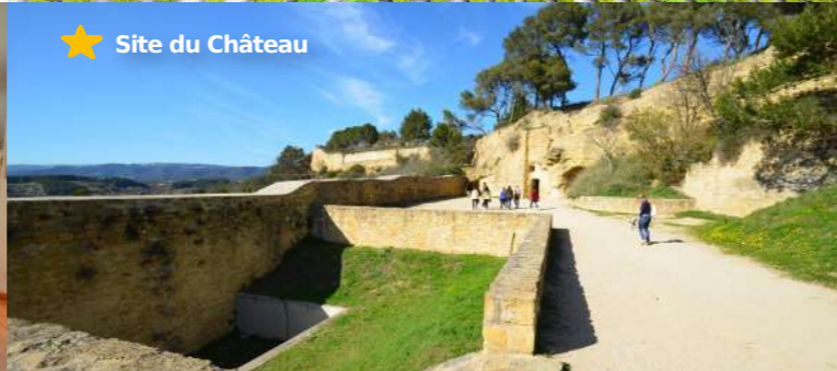
★ Site du Château