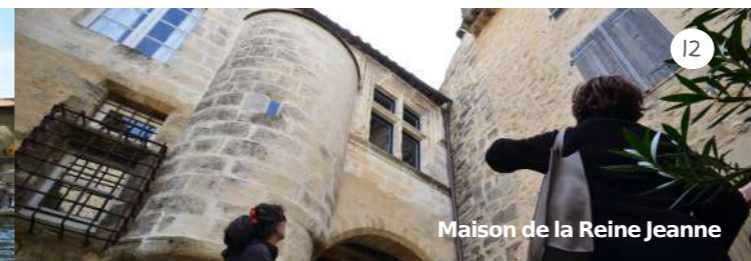
Maison de la Reine Jeanne