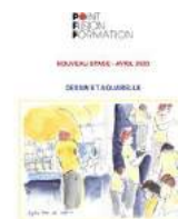
@Point Fusion croquis