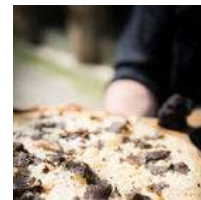
@Maison Edoard Loubet

https://www.moulinde Lourmarin.com/restaurant-du-moulin/