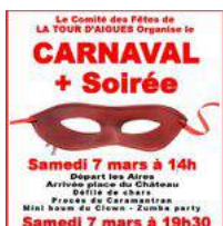
@carnaval de la tour